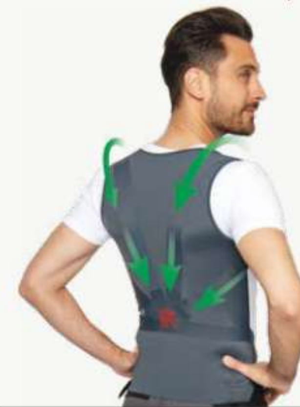
SECTEUR D'ACTIVITÉ TRANSPORT LOGISTIQUE

Depuis plusieurs années FM LOGISTIC teste et déploie des solutions en faveur de la Santé de ses collaborateurs pour réduire les accidents du travail et prévenir les maladies professionnelles. Le dispositif Percko est une des assistances techniques identifiées pour prévenir les douleurs de dos. Le site FM Logistic de Savigny sur Clairis travaille « pour la grande distribution et réalise entre autre de la préparation de commande ». Tâche nécessitant de la prise de colis sur des picking a double niveaux. Les poses et déposes de colis à des hauteurs basses (<1,20m) obligent les collaborateurs à adopter des postures contraignantes pour le dos. En 2019, 80% des accidents de travail étaient liés à des douleurs dans les membres supérieurs et au dos en lien avec la manutention.